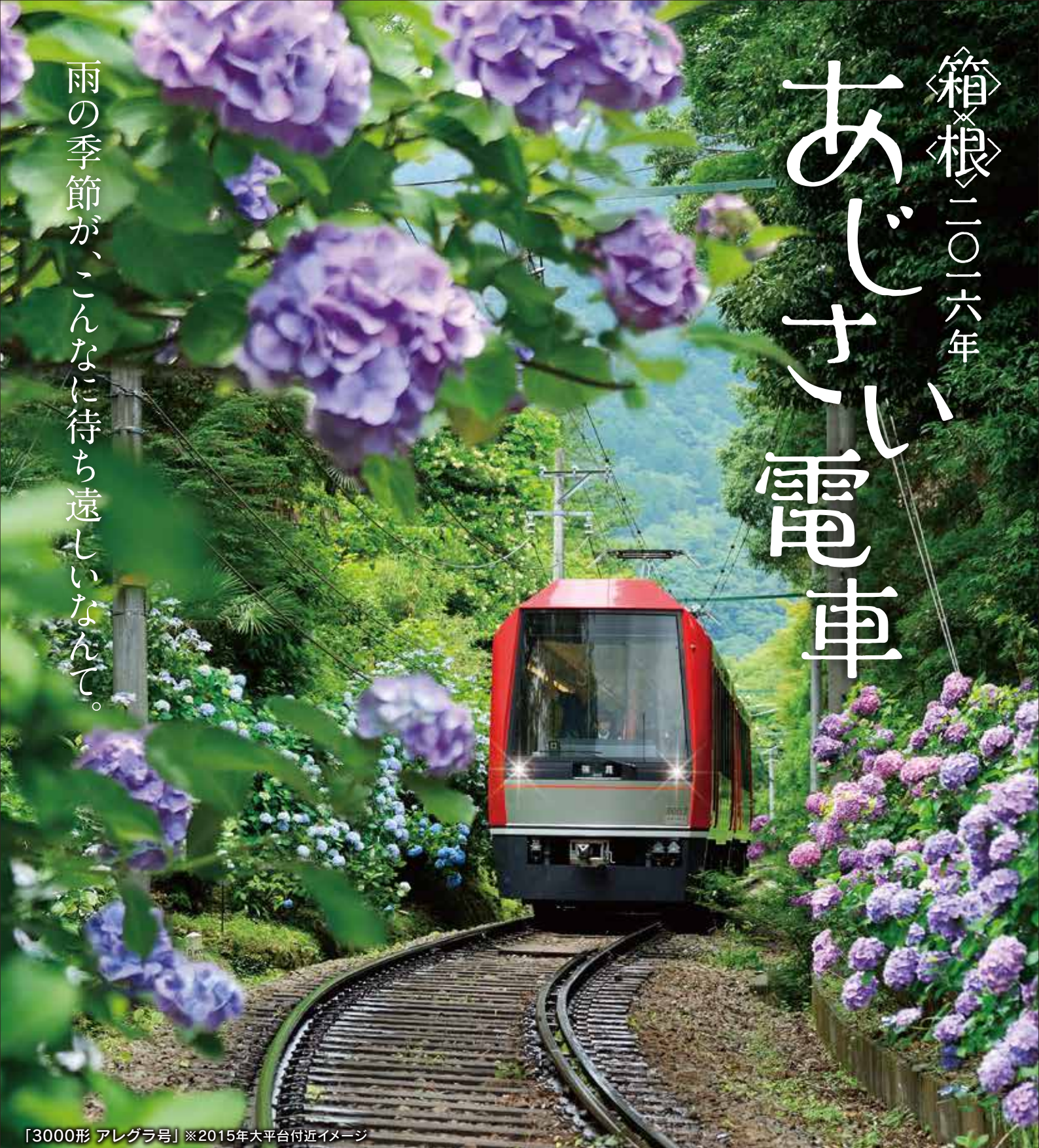
「3000形 アレグラ号」※2015年大平台付近イメージ